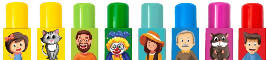
KUZYNKA KOT WUJEK KUZYN CIOCIA DZIADEK CHOMIK TATA