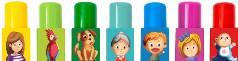
MAMA PAPUGA PIES BABCIA SYN CÓRKA DZIDZIA